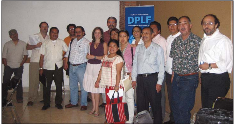
> Clausura de la reunión

(migración, descentralización, correlación de fuerzas políticas, etc.) ocasionando que el sistema tradicional de arreglos esté en crisis. Por ello es necesario dar mayor preeminencia a la realidad. Si se tiene esta flexibilidad, como se mostró en el caso de Santa Ana del Valle, el uso estratégico del Derecho puede apoyar los procesos de autonomía, no como la defensa rígida de un sistema, sino como el derecho que tiene la comunidad de decidir cómo llevar su vida; lo que ayudaría a evitar el estallido de violencia o a que los conflictos se encaucen institucionalmente.