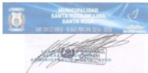
Llancarlos Dávila, Alcalde Municipal Municipio de Santa Rosa de Lima, Guatemala